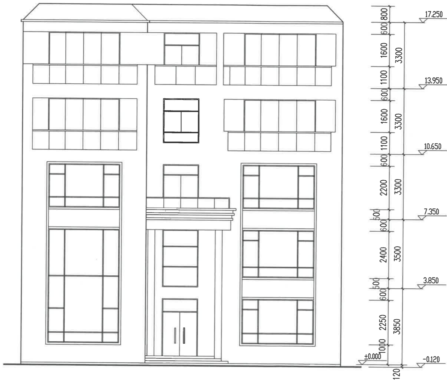
正立面图 1:100 (南)

广东建晟工程咨询有限公司 行业：市政、水利、公路、建筑行业 资质等级范围：工程设计行业丙级 资质证书编号：A444018206 有效期至：2026年07月19日 工程设计出图专用章