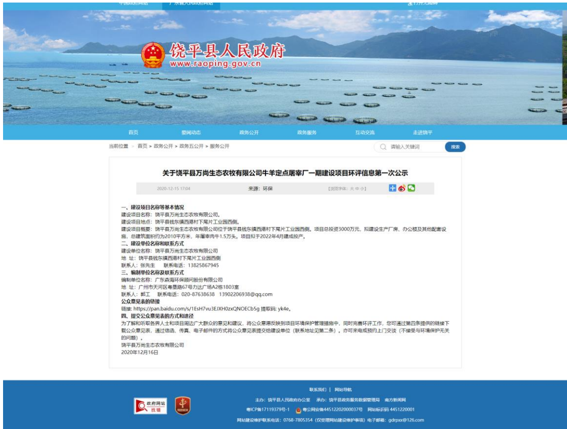
图 2-1 首次环评信息网上公示截图