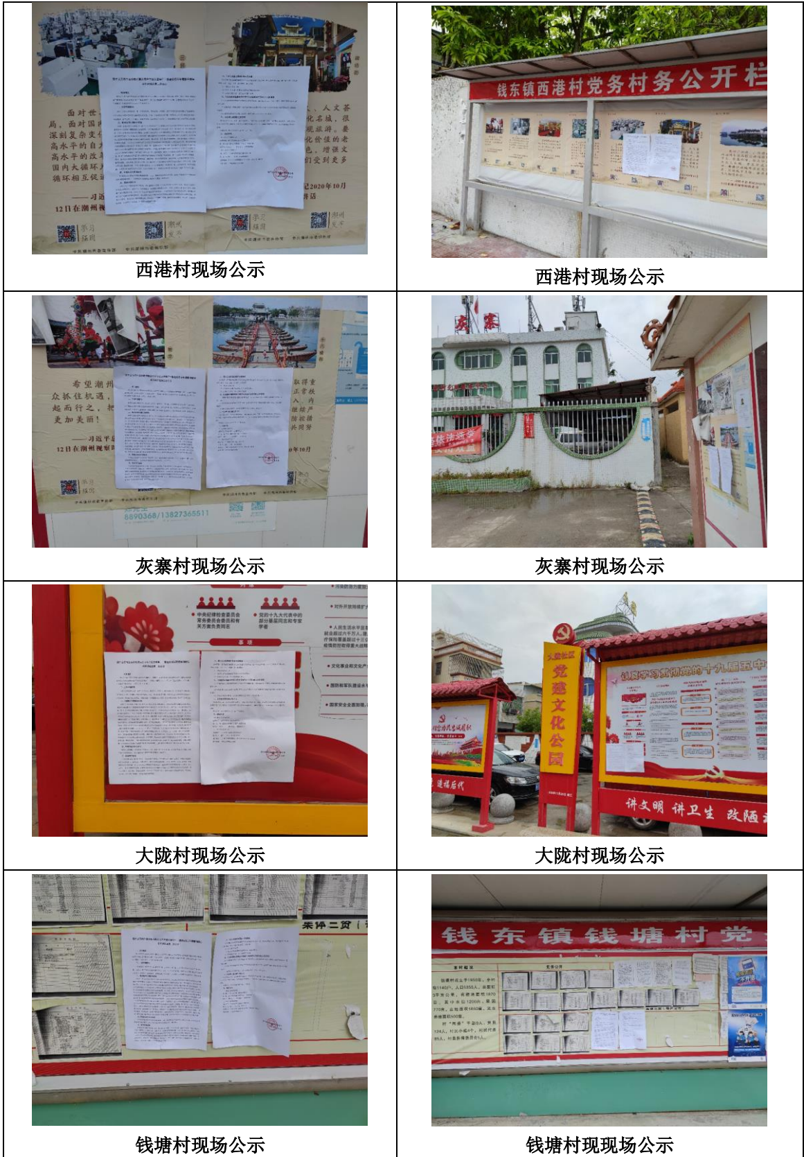
图 3-4 征求意见稿现场公示照片